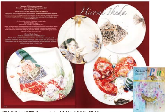
欧州絵付雑誌 Porcelain PLUS 2010. 掲載。