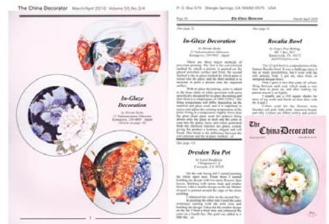
USA 絵付協会雑誌 The China Decorator 2010. 掲載。